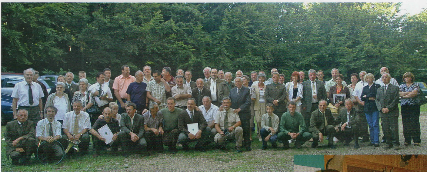
Sudionici proslave 60. obljetnice LD-a "Srndać" Brod Moravice

lovište se opet cijepa na "Završje" i "Kupjački vrh". Tada se obnavlja i LD "Srndać" Brod Moravice, no gubi na natječaju, a lovište "Završje" zakupljuje privatna osoba za malu novčanu razliku. Ipak Društvo ugovorno zakupljuje pravo odstrjela od BEV-a iz Pule te brine o lovištu. Na natječaju nakon 10 godina dobivaju koncesiju na 30 godina na svoje lovište, ali smanjeno